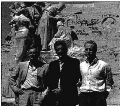
Petrarca deturpato Il sindaco e Confartigianato presentano il restauro. A destra un particolare della statua